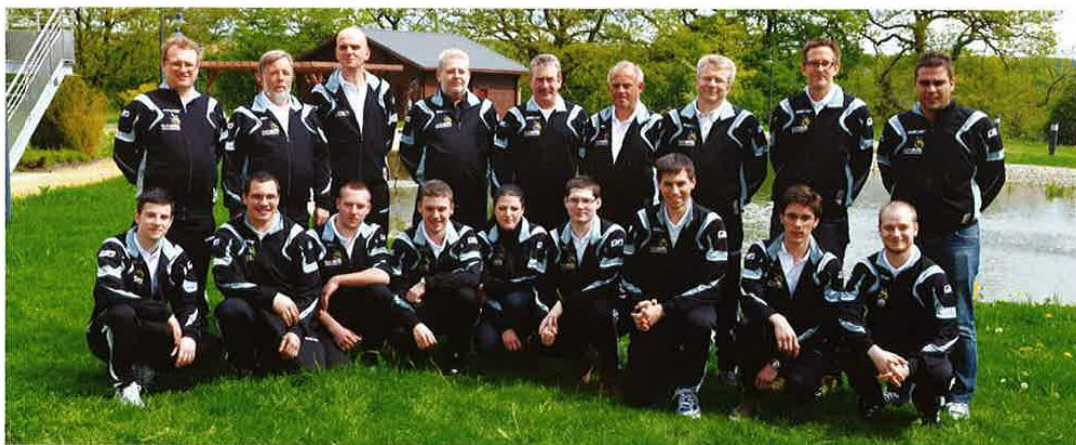
Les 11 candidats en lice et leur encadrement

Le CNFPC figurera d'ailleurs comme lieu central de préparation des candidats. Ainsi ils se verront offert un lieu de préparation adéquat afin de favoriser dès le départ les rencontres entre candidats, experts et membres officiels de l'équipe. Nous sommes convaincus que ces actions contribueront de façon significative à une meilleure préparation de nos talents.